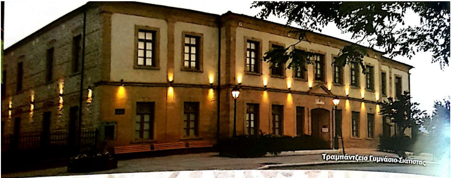
Τραμπάντζειο Γυμνάσιο Σιάποτας