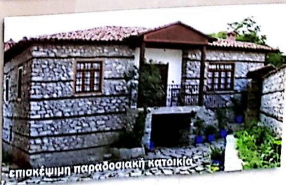
επισκέψιμη παραδοσιακή κατοικία