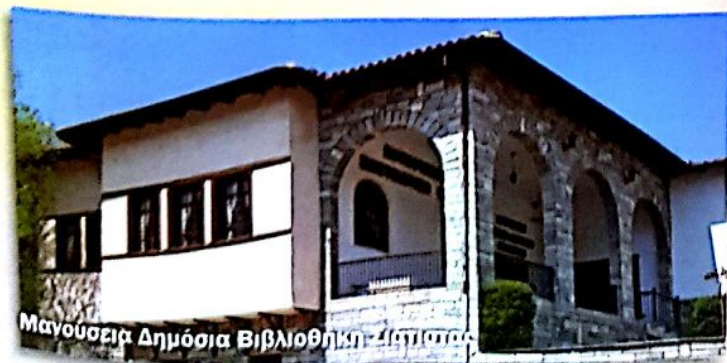
Μανούσεια Δημόσια Βιβλιοθήκη Σιάτιστας

Μανούσεια Δημόσια Κεντρική Ιστορική Βιβλιοθήκη Σιάτιστας. Ένα μεγάλο μέρος χειρογράφων και σπανίων εκδόσεων βιβλίων της είναι δωρεά του Θεόδωρου Μανούση, προς τιμήν του οποίου φέρει το όνομα Μανούσεια. Ο Θεόδωρος Μανούσης γεννήθηκε στη Σιάτιστα το 1793 και κατάγεται από οικογένεια πραγματευστών, συγκαταλέγεται δε μεταξύ των πρώτων καθηγητών του Πανεπιστημίου Αθηνών.