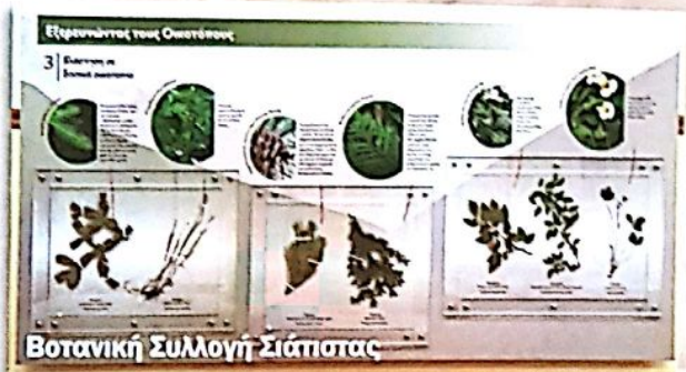
Βοτανική Συλλογή Σιάτιστας

Στο Ιστορικό Τραμπαντζείο Γυμνάσιο Σιάτιστας φιλοξενείται η Βοτανική Συλλογή με τα σπάνια είδη χλωρίδας του όρους Μπούρινος, ένας βοτανικός πλούτος που συναντά κανείς μόνο στην Κοιλιάδα του Μεσιού Νερού. Τη Συλλογή διαχειρίζεται ο Δήμος Βοΐου μαζί με τον Ορειβατικό Σύλλογο Σιάτιστας.