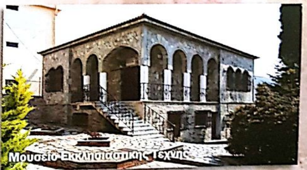
Μουσείο Εκκλησιαστικής Τέχνης

Το Μουσείο Εκκλησιαστικής Τέχνης ιδρύθηκε στις αρχές του 21 ου αιώνα μετά από σχετική πρόταση του Μακαριστού Μητροπολίτη Σισανίου και Σιατίστης Αντωνίου. Ξεχωρίζουν εικόνες με επιρροές από την κρητική σχολή του 16 ου αιώνα.